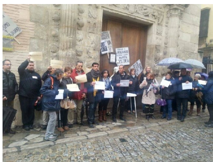
Concentración Arqueológico de Granada.

Trabajadores y trabajadoras de museos de Granada se han concentrado para reclamar la reapertura del museo arqueológico, además de continuar la protesta por el recorte de horarios que pretende la Consejería.