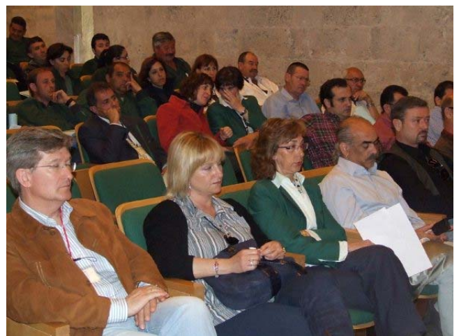
Asistentes a la Asamblea